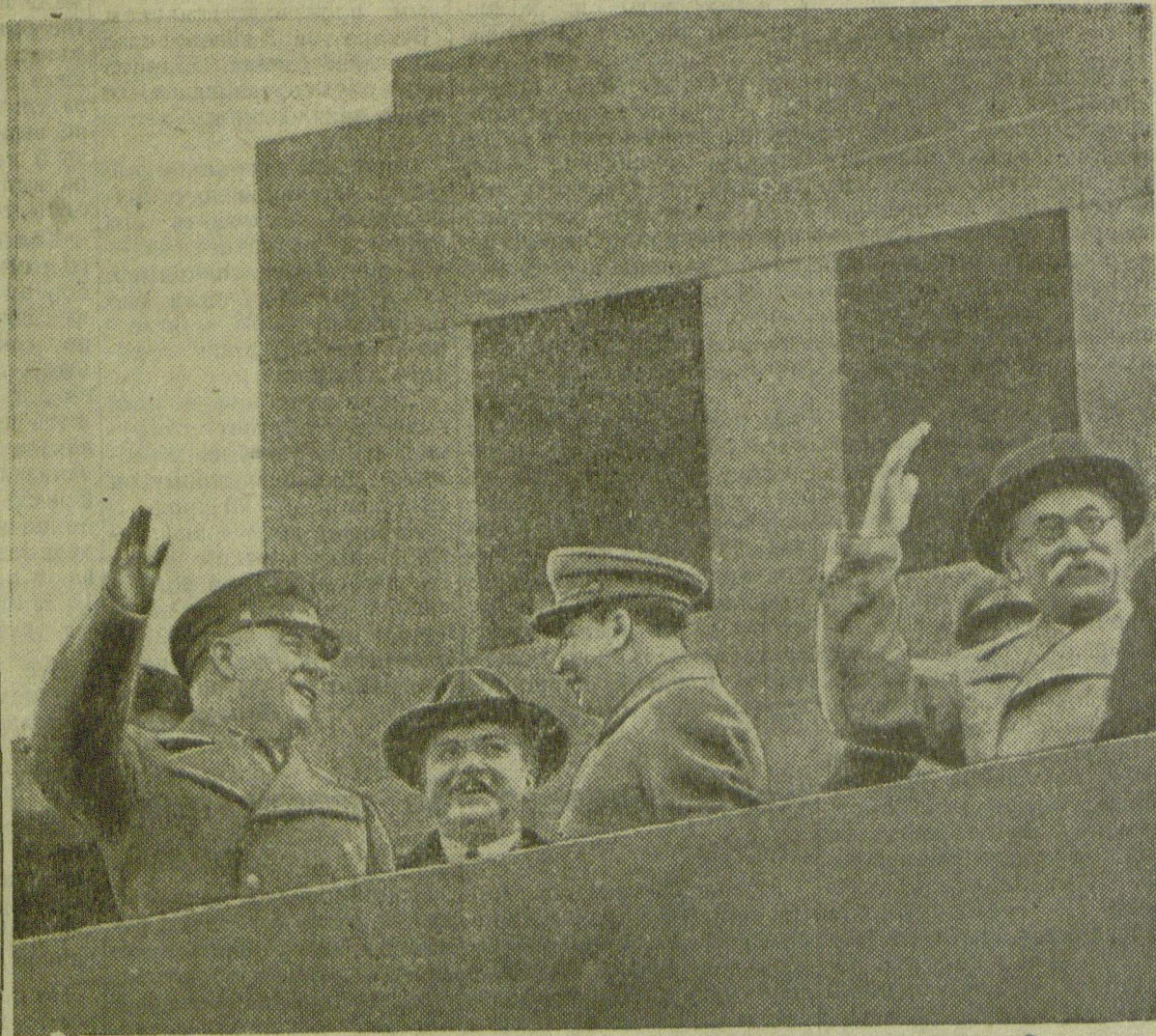
Празднование 1 мая в Москве. На снимке (справа налево): товарищи Ярославский, Сталин, Молотов и Ворошилов на трибуне мавзолея.

ЧТОБЫ ТРУДУ ПОКОРИЛАСЬ ЗЕМЛЯ, НАДО УМЕЛО ВЛАДЕТЬ И ЛОМОМ. НАША ЗАДАЧА—ДАТЬ ВОДУ ПОЛЯМ, ГОРОДАМ СТАВРОПОЛЬСКИМ И СЕЛАМ.